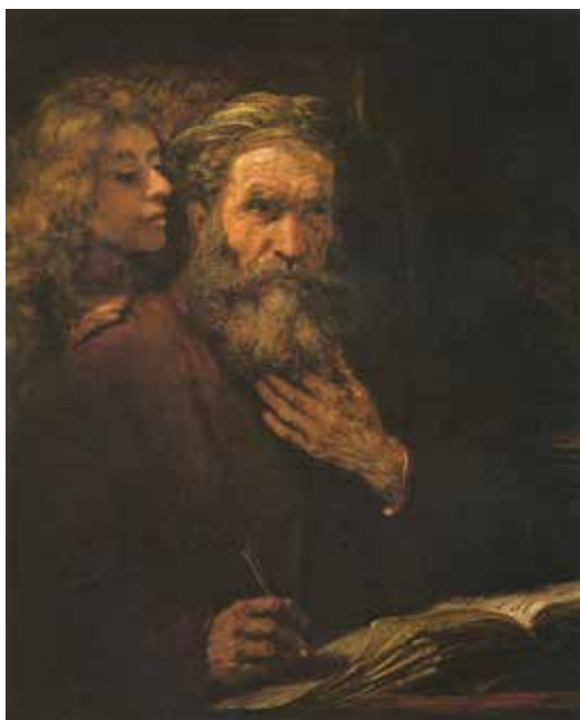
Saint Mathieu et l'Ange Rembrandt

Depuis quelques années, nous vous proposons dans les pages du VEAB, des introductions aux livres bibliques. Or, l'évangile de Matthieu, curieusement, n'y figurait pas encore... Il est pourtant évidemment l'un des piliers de notre foi chrétienne. C'est l'Évangile réputé être le plus « juif » car rédigé au sein d'une communauté nourrie par cette culture et ces lectures de la littérature juive, rabbinique en particulier. C'est celui des quatre qui cite le plus les textes de l'Ancien Testament. Redécouvrons-le.