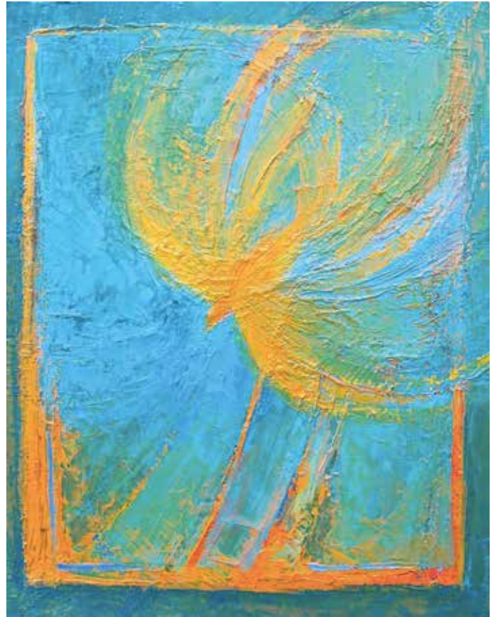
Pentecôte. « Vous connaissez l'Esprit de vérité car il est en vous » Jean 14, 17, Macha Chmakoff, huile sur toile (81x65)