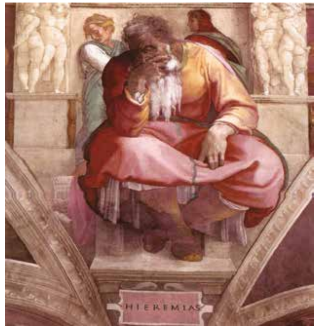
Le prophète Jérémie, par Michel-Ange, 1511-1512 Chapelle Sixtine, Vatican

Le principal acteur, dans le livre de Jérémie, est la parole de Dieu. Cette parole possède une force qui lui permet de triompher de tous les obstacles. Elle s'impose aussi bien aux auditeurs qu'au prophète. Comme chez les autres prophètes, cette parole énoncée par le prophète est une parole de jugement. Mais, dès la vocation de Jérémie, on voit que la parole n'aura pas uniquement pour but la dénonciation du mal, mais aussi l'édification et la restauration de quelque chose de neuf. C'est une parole efficace car Dieu veille à son accomplissement. C'est bien le sens de la vision inaugurale de l'amandier (1,11-12). Cette parole est donnée au prophète, littéralement «mise dans sa bouche» (1,9). C'est une parole qui s'impose aux hommes, même si ceux-ci ne désirent pas la recevoir. L'écrit est vulnérable, on peut s'en emparer et le détruire comme le fera effectivement le roi. Mais si le livre est brûlé, la parole demeure et on pourra toujours réécrire un nouveau livre. La parole s'impose également aux hommes par son accomplissement. Ce qu'elle annonce advient. Les manœuvres des hommes n'y peuvent rien. Mais cet accomplissement inéluctable de la parole devient aussi facteur d'espérance lorsqu'elle annonce un futur rétablissement.